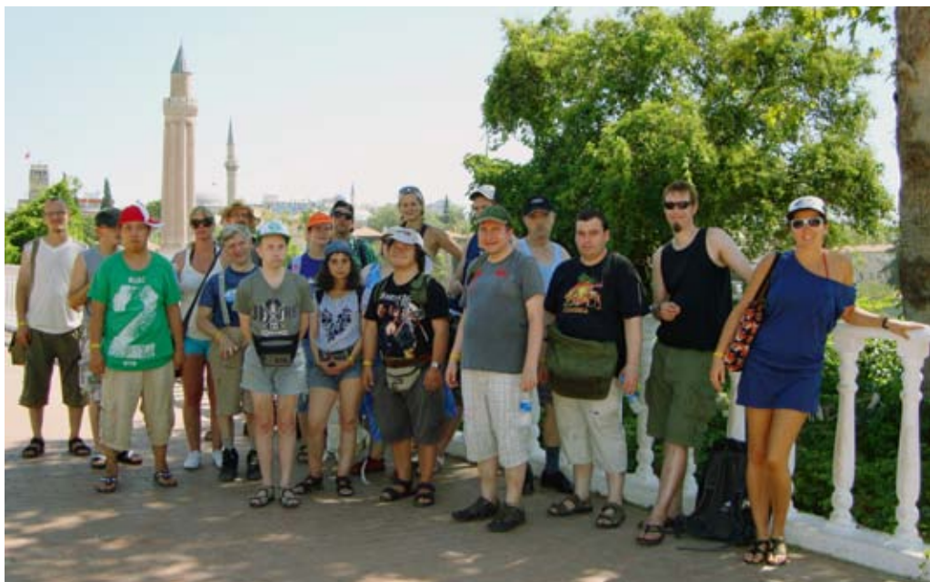
Sonne pur und beste Urlaubsstimmung bei der Reisegruppe aus den Ambulanten Diensten Prenzlauer Berg.

Eigentlich verreisen wir jedes Jahr. Doch dieses Jahr war unsere Reise besonders schön und groß. Das kam so: Normalerweise fahren wir mit unserer kleinen Gruppe aus dem Betreuten Einzelwohnen weg. Aber diesmal haben wir uns gedacht, wir fragen mal rum, wer vielleicht noch mitkommen will. Unser Plan war wegzufiegen. Wir hätten nicht gedacht, dass so viele wollten. Am Ende waren wir