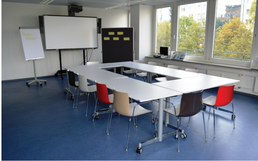
Seminarraum in der Zentrale der Lebenshilfe Berlin Heinrich-Heine-Straße